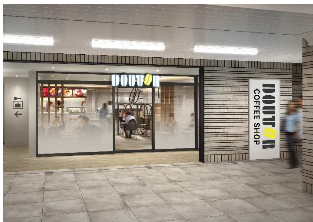
ドトールコーヒーショップ店舗外観イメージ

ドトールコーヒーショップは「すべての今日を、支えていく。」というブランドスローガンのもと、人々の暮らしに欠かせないカフェを目指しています。鉄道も同じく人々の暮らしに欠かせないものであり、長年生活を支えてきた「青胴車」の部品を活用した店内壁面を新たな姿で飾るアート作品には、コーヒー片手にそれを眺め、何気なく当たり前のようにある存在の大切さに気付いてもらえたら、という想いが込められています。