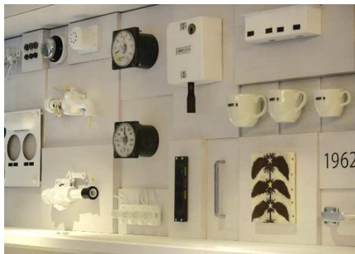
ドトールコーヒーショップ阪神大阪梅田駅店のアート装飾

長きにわたり、みなさまの足として活躍した5001形車両をモチーフに、駅ナカ店舗らしさをお楽しみいただける仕様となっています。