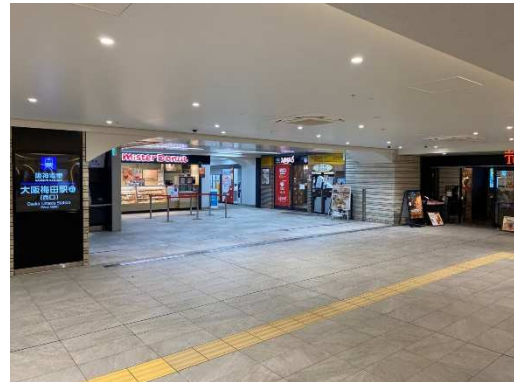
西改札 左：百貨店口 右：西口

駅ナカ店舗でも阪神電車をお楽しみいただけるよう、ドトールコーヒーショップ阪神大阪梅田駅店では、「青銅車」、「ジェット・カー」の愛称で親しまれてきた5001形車両の部品をアートとして内装に活用します。また、阪神ドリームプラザ梅田店では、店舗外装に同車両のラッピングを施します。