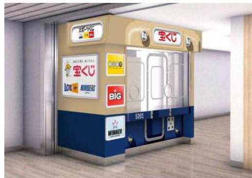
阪神ドリームプラザ梅田店のラッピングイメージ